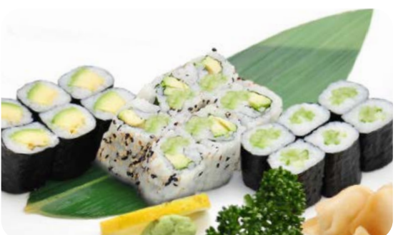
MM8 MAKI VÉGÉ 13.90€ soupe, salade 6 California végétarien, 6 maki avocat, 6 maki concombre