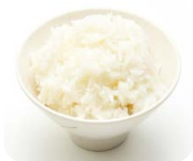
1 Riz nature 3€00