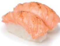
SU12 Saumon braisé 4€60