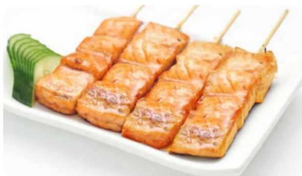
X13 brochettes de poissons (4 saumon)