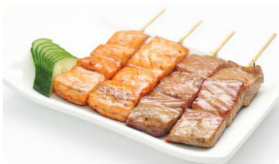
MB5 YAKI POISSONS 13.90€ Salade, soupe, riz 4 brochettes : 2 saumon, 2 thon