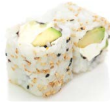
CA6 Cheese avocat 5€80