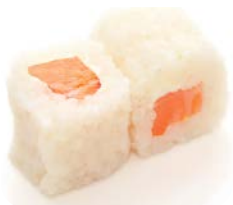
MG1 Saumon cheese 4€90