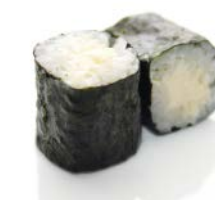
MA6 Cheese 4€40