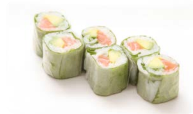
X10 Maki printemps saumon avocat (6 pièces)