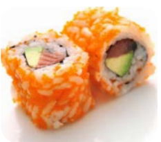
TR1 Saumon avocat 6€90