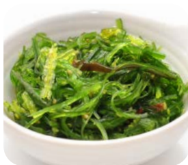
7 Salade d'algue 6€00