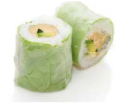
P3 Thon cuit avocat 6€90