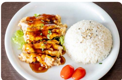
MP8 Poulet croustillant 12.90€