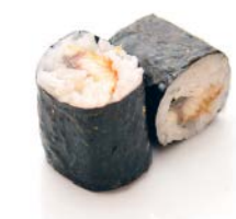
MA5 Anguille 6€00