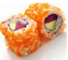
TR2 Thon rouge avocat 6€90