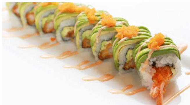
SP1 Dragon (tempura crevette, avocat, tobiko, spicy mayo, sauce anguille) 11€90