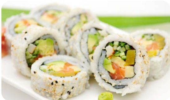
MM5 FUTO MAKI 14.90€ soupe, salade 8 futo maki (Concombre, avocat, saumon, thon, crevette)