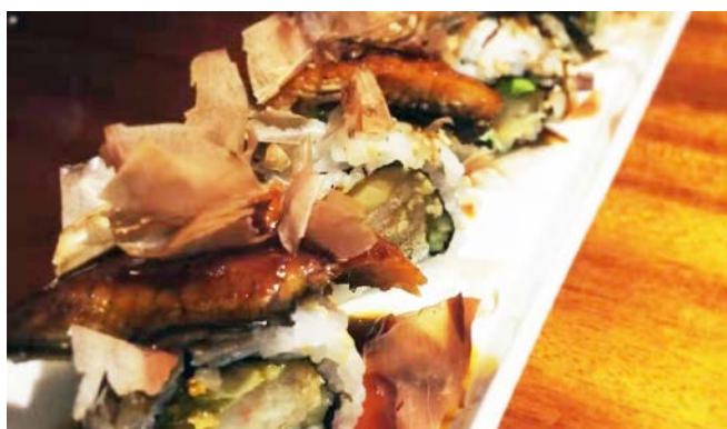
SP5 Unagiii (anguille grillé, tempura crevette, avocat, concombre, bonito, sauce anguille) 12€90