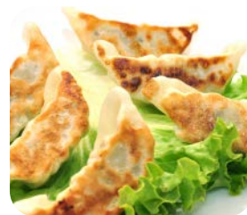
4 Gyoza (5 pièces) Raviolis aux poulet 6€50