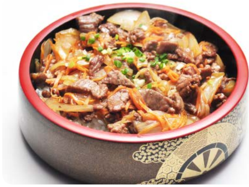
MP1 DONBURI BOEUF 13.90€