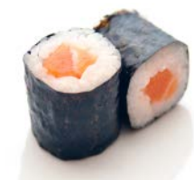
MA1 Saumon 4€60