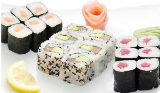
MM1 MAKI CLASSIQUE 15.20€ soupe, salade 6 maki saumon, 6 california saumon avocat, 6 maki thon