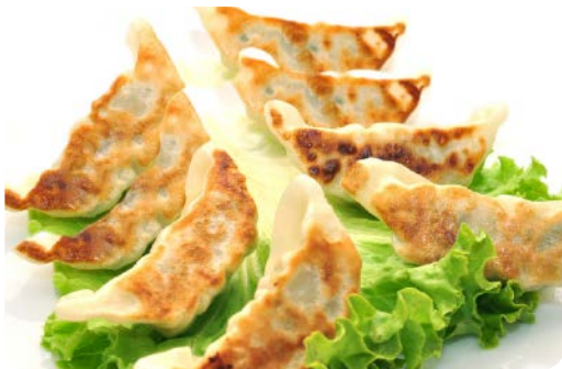
MP4 MENU GYOZA 12.90€

(poulet pané aux œufs mi-cuit sur riz nature)