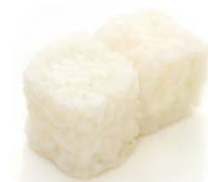
MG4 Cheese 4€50