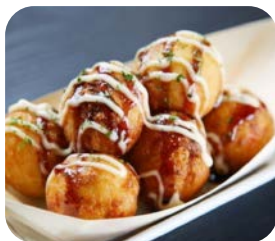
11 Takoyaki (5 pièces) 7€90