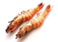
B10 Gambas 6€00