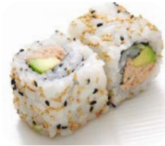
CA2 Thon cuit avocat 6€10