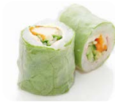
P2 Crevette avocat 6€90