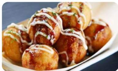
X5 takoyaki (5 pièces)