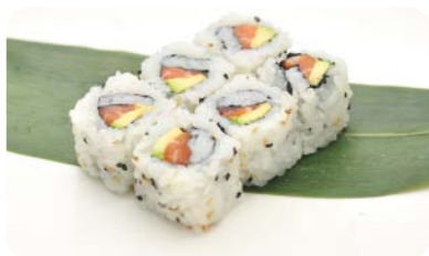
X6 California saumon avocat (6 pièces)