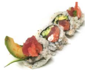
F1 Saumon, thon, crevette, avocat, concombre 7€50