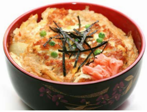
MP3 KATSUDON 13.90€

Poulet sauté au poivrons (sur un bol de riz)