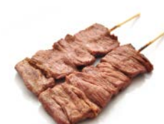
B4 Boeuf 4€40