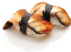
SU7 Anguille 6€00