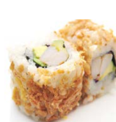
C4 Crevette avocat 6€30