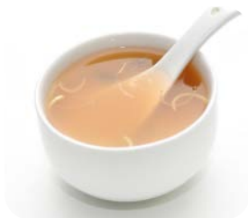
2 Soupe miso 3€00