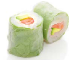
P1 Saumon avocat 6€90