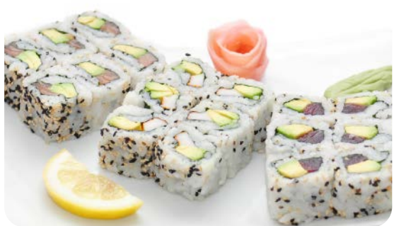
MM2 CALIFORNIA MIXTE 17.90€ soupe, salade 6 california avocat saumon, 6 california avocat thon, 6 california avocat crevette