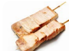
B9 Thon 6€00