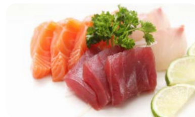
X7 sashimi thon et saumon (8 pièces)