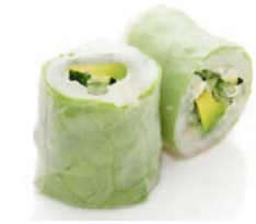
P4 Végétarien 6€50