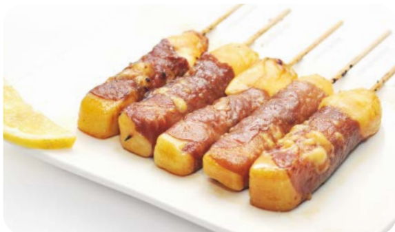
MB6 YAKI BOEUF FROMA 13.50€ Salade, soupe, riz 5 brochettes : 5 boeuf au fromage