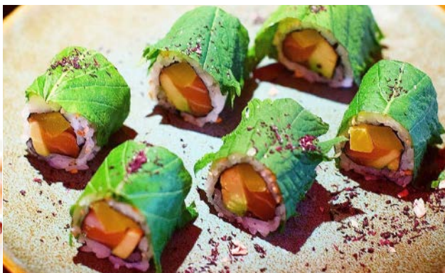
SP4 Shiso bombe (saumon, radis jaune, concombre, feuille shiso) 10€50