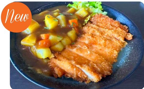
MP7 CURRY JAPONAIS 15.50€

(Curry japonais, poulet pané, pomme de terre, oeuf et carottes en sauce curry, accompagné du riz)