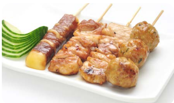
X12 brochettes de viande (1 boulette de poulet, 1 bœuf au fromage, 2 cuisse de poulet)