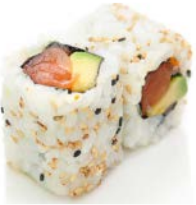
CA1 Saumon avocat 6€10