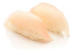
SU4 Daurade 4€60