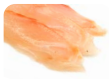
SA3 Daurade 12€00