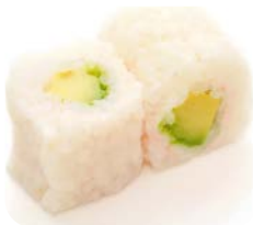
MG3 Avocat cheese 4€90