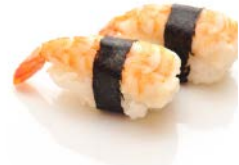
SU5 Crevettes 5€10