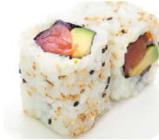
CA7 Thon rouge avocat 6€50