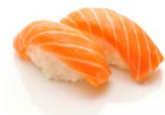
SU1 Saumon 4€40