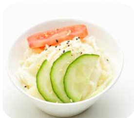
3 Salade aux choux 3€00