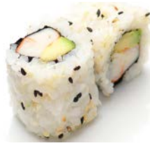
CA3 Crevette avocat 6€30