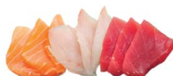
SA6 Assortiment 13€50