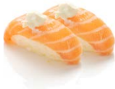
SU2 Saumon cheese 4€60