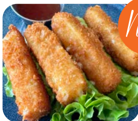
14 Tempura fromage (4 pièces) 7€80