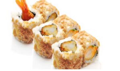
X11 Crispy roll tempura crevette (6 pièces)