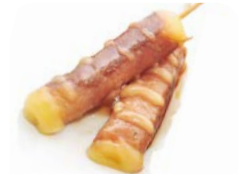
B5 Boeuf fromage 5€00