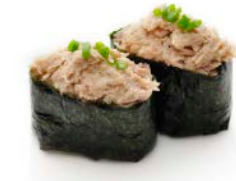
SU11 Tartare thon cuit ciboulette 5€40