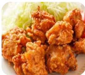
10 Poulet gingembre (5 pièces) ou poulet karage (6 pièces) 6€10