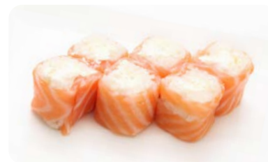
X8 saumon Roll cheese (6 pièces)