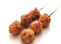
B1 Boulette de poulet 4€00