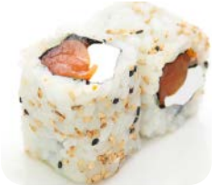
CA5 Saumon cheese 6€10