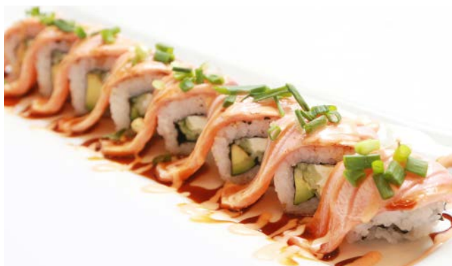
SP3 Tiger (tataki saumon, tempura crevette, avocat, cheese, piment en poudre) 12€50