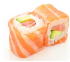
SR4 Saumon avocat 7€20