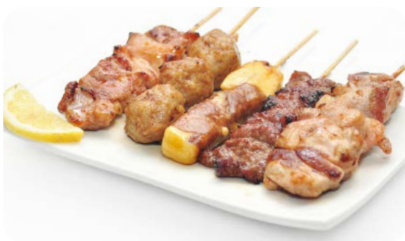
MB4 YAKI CLASSIQUE 12.50€ Salade, soupe, riz 5 brochettes : 2 poulet, 1 boulette poulet, 1 boeuf, 1 boeuf fromage