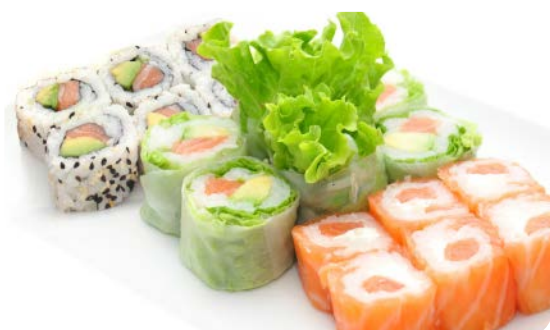
MM7 MAKI 3 COULEURS 18.90€ soupe, salade 6 maki printemps saumon avocat, 6 saumon roll saumon cheese, 6 california saumon avocat