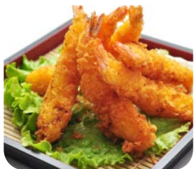
5 Tempura crevette (4 pièces) 6€50