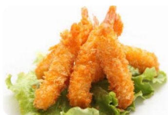
X3 tempura crevette (4 pièces)