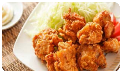
X4 poulet gingembre (5 pièces) ou poulet karage (6 pièces)