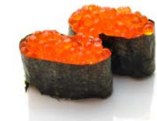
SU9 Oeuf de massago 6€00