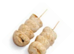
B6 Champignons 4€20