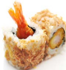
C1 Tempura avocat 7€50