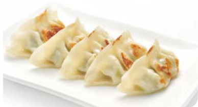
X1 gyoza (5 pièces)