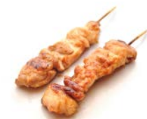
B2 Poulet 4€30