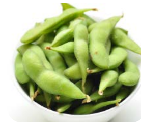
8 Edamame 5€30