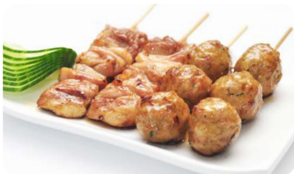
MB1 YAKI CHIKIN 10.50€ Salade, soupe, riz 4 brochettes : 2 poulets, 2 boulette de poulet