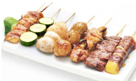
MB7 YAKI MIX 15.50€ Soupe, salade, riz, 7 brochettes : 2 poulet, 1 boulette poulet, 1 boeuf, 1 boeuf fromage 1 champignons, 1 courgette