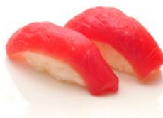
SU3 Thon 5€00