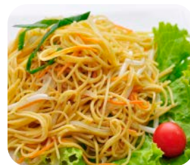
12 Nouille sauté au légume 10€50