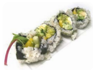
F3 Algue concassée, avocat, concombre, radis jaune, cheese, salade 7€50