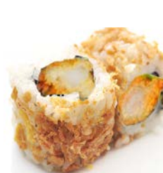
C3 Poulet gingembre 6€10