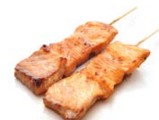
B8 Saumon 5€50