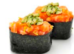
SU10 Tartare saumon ciboulette 5€40