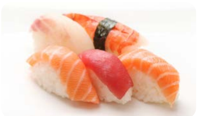
X9 sushi assortiment (5 pièces)