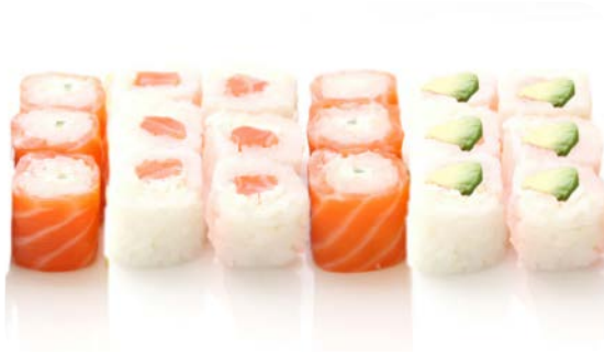
MM3 MAKI NOVATION 15.90€ soupe, salade 6 neige saumon cheese, 6 neige avocat cheese, 6 saumon roll cheese