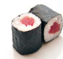
MA2 Thon 5€00