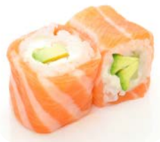
SR3 Avocat cheese 7€00