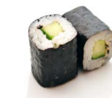
MA8 Concombre 4€20