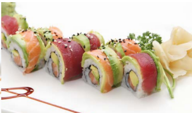
SP2 Tora roll (saumon, thon, daurade, avocat, grain de sésame) 11€90