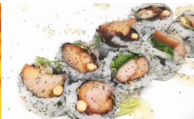
SP6 César (poulet gingembre, gressins, salade, gains de pavot, sauce César) 10€50