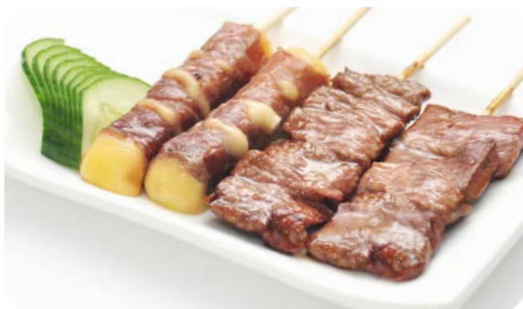
MB2 YAKI GYUNIKU 11.50€ Salade, soupe, riz 4 brochettes : 2 boeuf fromage, 2 boeuf