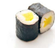
MA4 Radis jaune 4€60