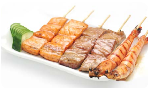
MB8 YAKI ROBATA 17.50€ Soupe, salade, riz, 6 brochettes : 2 thon, 2 saumon, 2 gambas