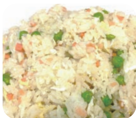
13 Riz cantonnais 7€50