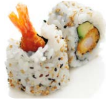
CA8 tempura avocat 7€50