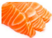
SA1 Saumon 12€90