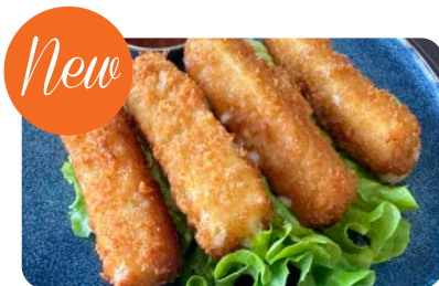
X5Bis Tempura fromage (4 pièces)