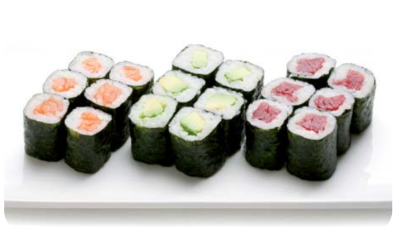
MM4 MAKI NORI 12.90€ soupe, salade 6 maki saumon, 6 maki thon ,6 maki avocat