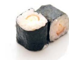
MA3 Crevette 4€80