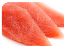
SA2 Thon 14€50