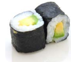
MA7 Avocat 4€20