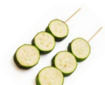
B7 Courgette 4€20