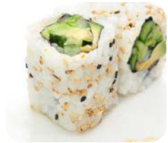
CA4 Végétarien 5€70