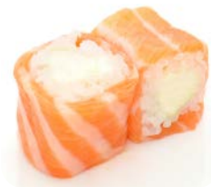
SR1 Cheese 6€50