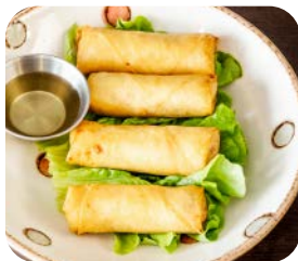
6 Nêms au poulet (4 pièces) 5€90