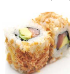
C2 Saumon avocat 6€10