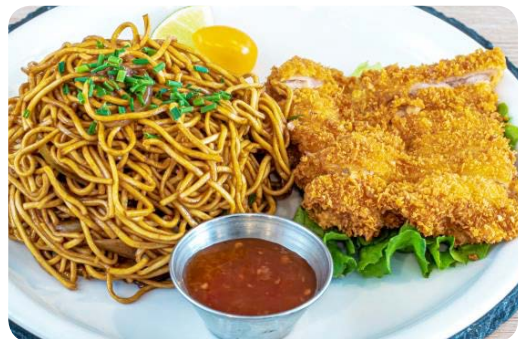
MP6 Nouilles Poulet pané 14.50€

(Curry japonais, poulet pané, pomme de terre, oeuf et carottes en sauce curry, accompagné du riz)