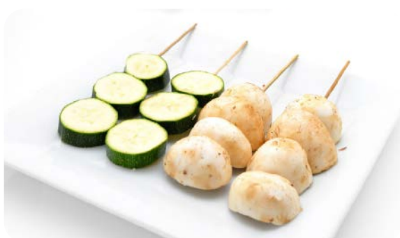
MB3 YAKI VEGÉ 9.50€ Salade, soupe, riz 4 brochettes : 2 champignons, 2 courgette