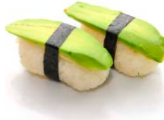
SU6 Avocat 4€30