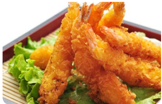
MP5 MENU TEMPURA 15.90€