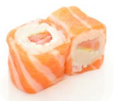
SR2 Saumon cheese 6€70