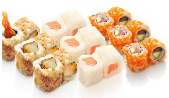
MM6 MAKI 3 COULEURS BIS 18.90€ soupe, salade 6 crispy roll tempura crevette, 6 maki neige saumon cheese, 6 tokibo roll saumon avocat