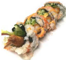
F2 Tobiko, concombre tempura crevette, avocat, salade, spicy mayo 7€50