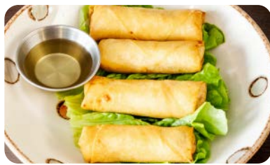
X2 nêms au poulet (4 pièces)