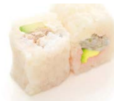
MG2 Thon cuit avocat 4€90