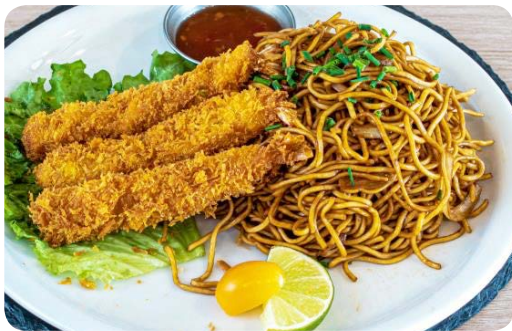
MP6Bis Nouilles tempura crevettes 14.50€

nouilles sauté au oignons, poulet pané, accompagnement une soupe miso et salade de chou.