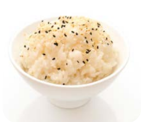
9 Riz vinaigre 3€30